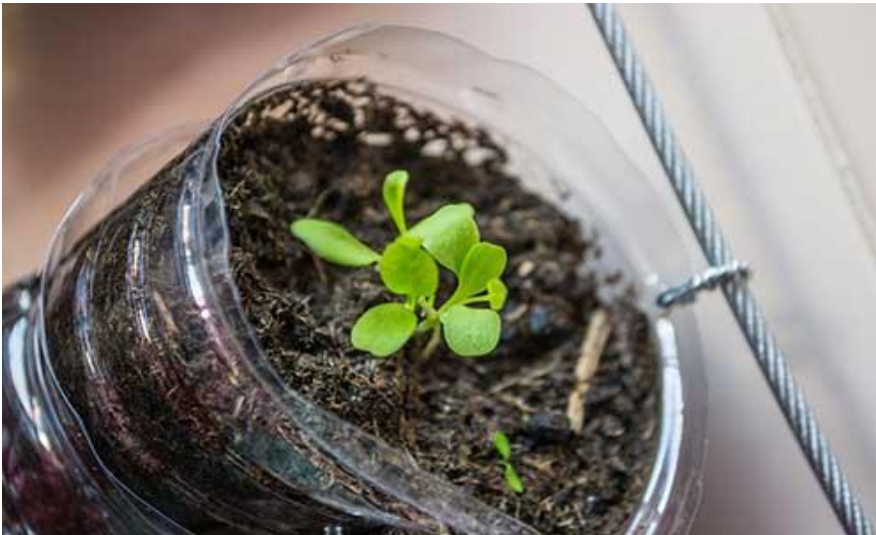
Muda de almeirão