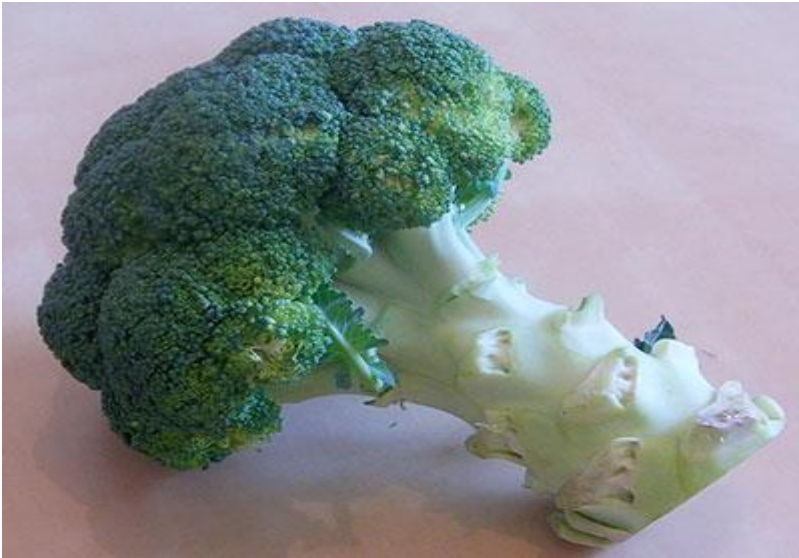
Brócolis-de-cabeça, brócolis-ninja ou brócolis-americano

Faça adubações com adubo que contém boro e molibdênio em regiões onde o solo é pobre nestes micronutrientes. A carência destes elementos prejudica o crescimento das plantas e suas inflorescências.