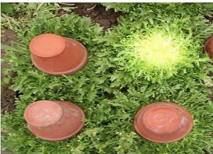
Branqueamento das folhas de chicória usando vasos para cobrir as plantas

As chicórias também podem ser cultivadas em vasos e jardineiras de tamanho médio ou grande.