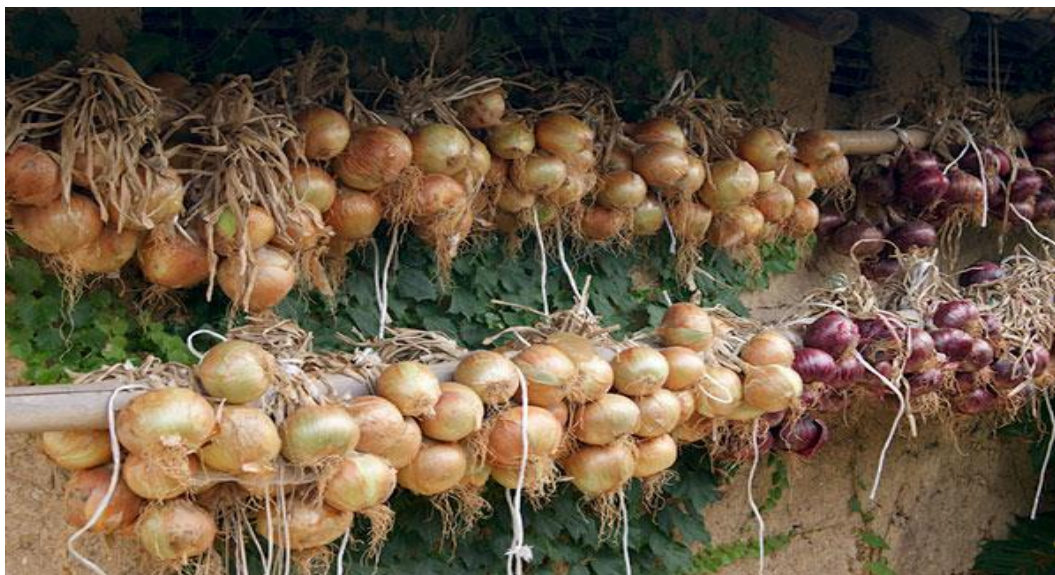
Cebolas amarradas em varais

Para consumo imediato, arranque os bulbos quando necessário. Para armazenar os bulbos por até alguns meses (geralmente de 3 a 6 meses, dependendo do cultivar e das condições de cura e armazenagem), espere até que as folhas mais velhas fiquem secas e os bulbos adquiram a cor característica do cultivar utilizado. Arranque a planta inteira, sem que as folhas se soltem do bulbo. A cura é o processo em que a cebola perde o excesso de água. Consiste em deixar as cebolas secando ao sol por 3 a 10 dias, sendo menos dias em regiões quentes e de alta insolação e 10 dias em regiões de alta latitude e menor insolação. Após este período, quando as folhas e a camada externa dos bulbos estiverem completamente secas, as cebolas podem ser armazenadas em locais frescos e secos, em tranças feitas com as próprias folhas, amarradas em varais de madeira ou bambu, ou em caixotes, cortando as folhas e deixando apenas os bulbos. É importante para a conservação das cebolas manter os bulbos secos e com boa ventilação.