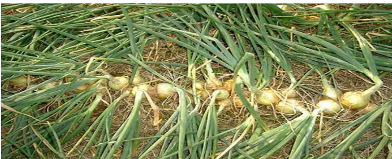
Em alguns cultivares as folhas tombam quando se aproxima a época da colheita

A presença de plantas invasoras prejudica muito as mudas de cebola, assim estas devem ser eliminadas regularmente até o completo crescimento da planta, tomando o cuidado de não causar danos para as mudas.