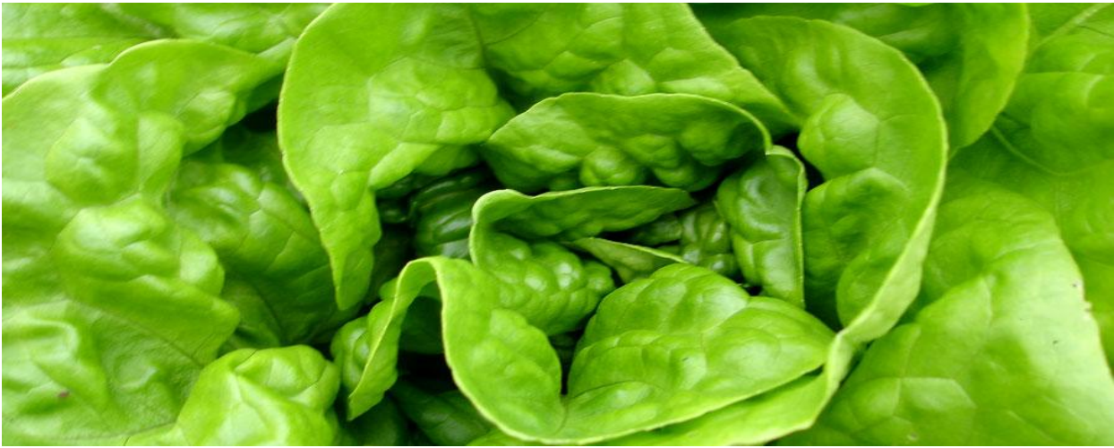
Alface - imagem original: http://flic.kr/p/5bmmS6

Varietades: genericamente, existem quatro grupos principais de variedades, reunidos em função de sua aparência.