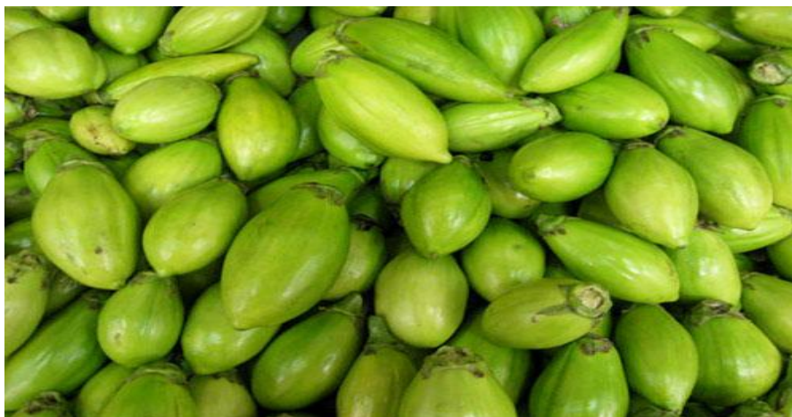
Jiló comprido verde-claro