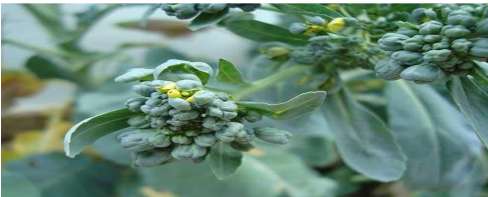
Brócolis de ramos

O momento de colher é quando as inflorescências estão bem desenvolvidas e com uma cor intensa, mas antes que as flores comecem a abrir.