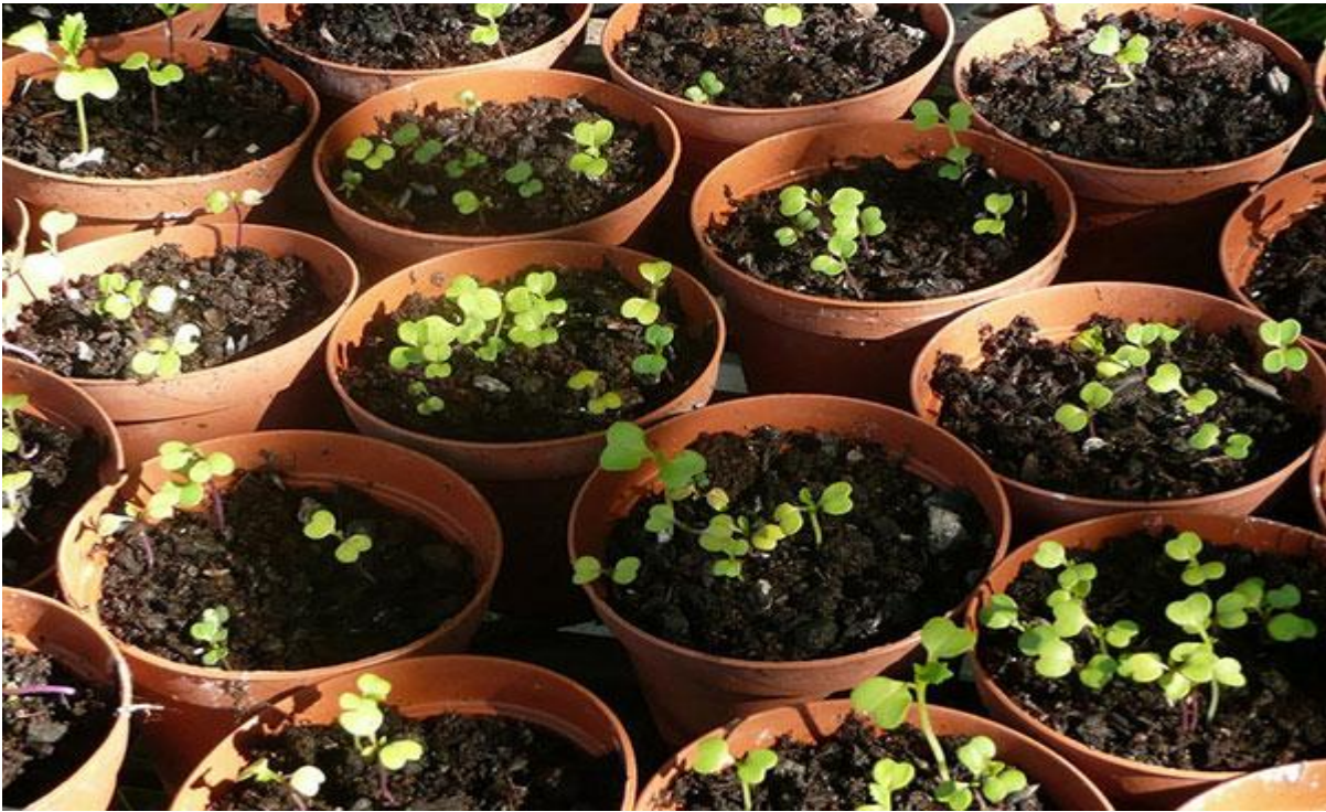
Mudas de brócolis