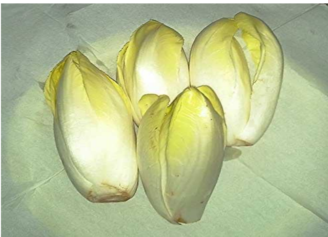
Endívias belgas ( Cichorium intybus var. foliosum )

A colheita pode ocorrer de 50 a 100 dias depois da sementeira, dependendo do cultivar plantado e das condições de cultivo. Os cultivares que têm folhas soltas podem ter estas colhidas individualmente quando necessário. As plantas que são totalmente cortadas na colheita, podem rebrotar e proporcionar novas colheitas.