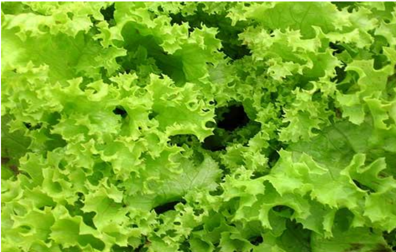
Alface crespa ou alface frisada