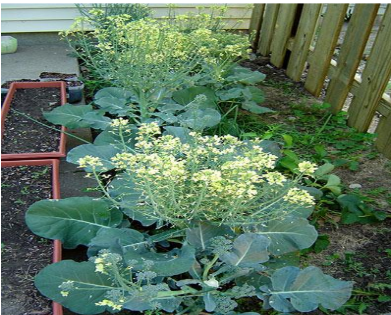
O brócolis precisa ser colhido antes que as flores se abram

As sementes podem ser plantadas diretamente no local definitivo, seja este um canteiro na horta ou vasos grandes. Também podem ser plantadas em sementeiras, vasos pequenos, copinhos de plástico ou de jornal, e transplantadas quando as mudas têm de 4 a 6 folhas. Os brócolis são sensíveis ao transplante, assim tome muito cuidado para não danificar as mudas e suas raízes. Transplante de preferência no fim da tarde, com o solo bem úmido.