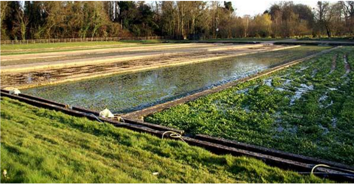
Cultivo de agrião em ambiente controlado