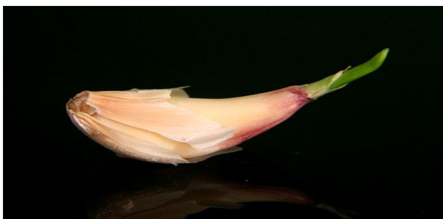
Dente de alho brotando

O alho deve ser irrigado com frequência para que o solo seja mantido úmido durante a fase de crescimento da planta. Diminua a frequência das irrigações quando os bulbos estiverem crescendo. Cerca de 10 a 20 dias antes da colheita, suspenda a irrigação.