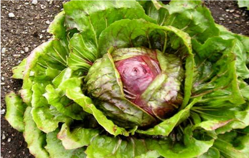
Cultivar "Pallarossa" de radicchio ou chicória vermelha

Uma prática que pode ser realizada em endívias é o branqueamento ou estiolamento. Tem o objetivo de deixar as endívias menos amargas, mais claras e mais tenras, e consiste de deixar as plantas privadas de luz antes da colheita, durante aproximadamente 15 dias. Para tal existem diversos métodos, como amontoar e amarrar as folhas externas de forma a privar as folhas mais jovens de luz, colocar um objeto (por exemplo um prato ou vaso) sobre o centro de cada planta, ou cultivar em vaso e cortar todas as folhas da planta, deixando que a planta rebrote em um local escuro até o momento da colheita.