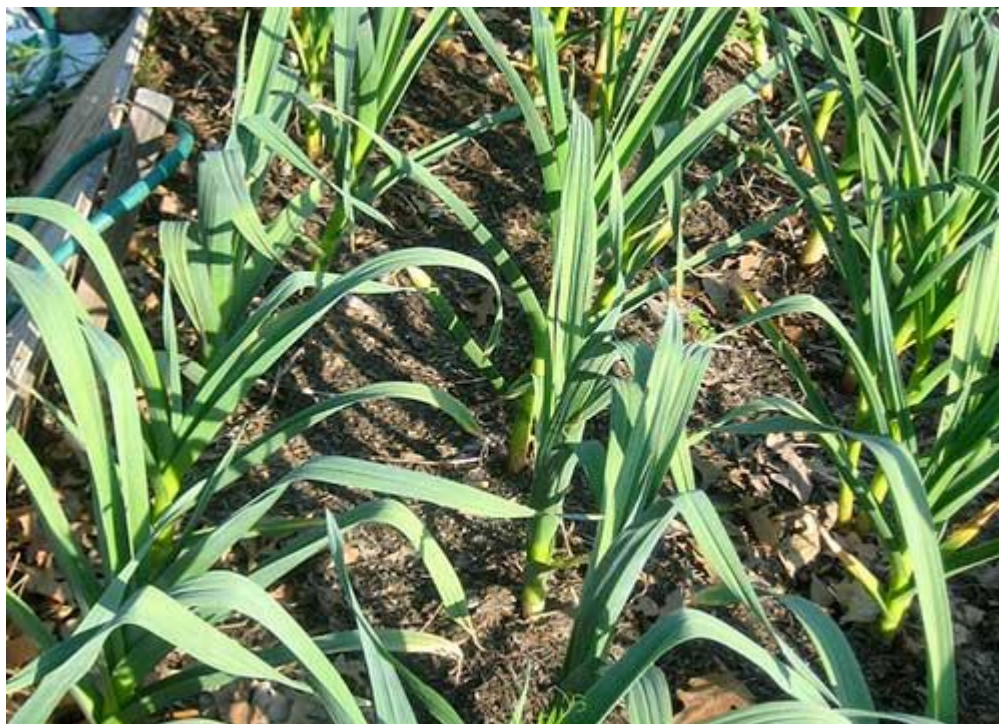
Plantação de alho

O alho deve receber luz solar direta pelo menos algumas horas por dia.