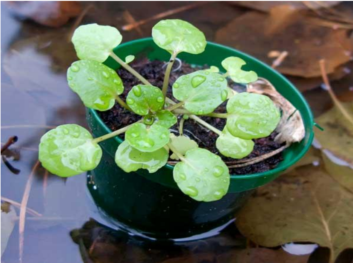
Muda de agrião