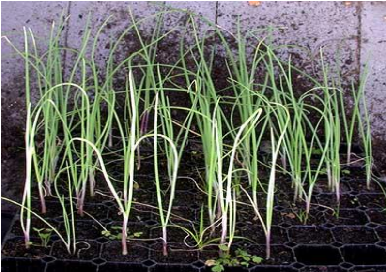
Mudas de cebola

A cebola deve ser irrigada com frequência para que o solo seja mantido úmido durante a fase de crescimento da planta. Diminua a frequência das irrigações quando os bulbos estiverem crescendo. Perto da época da colheita pare completamente a irrigação.