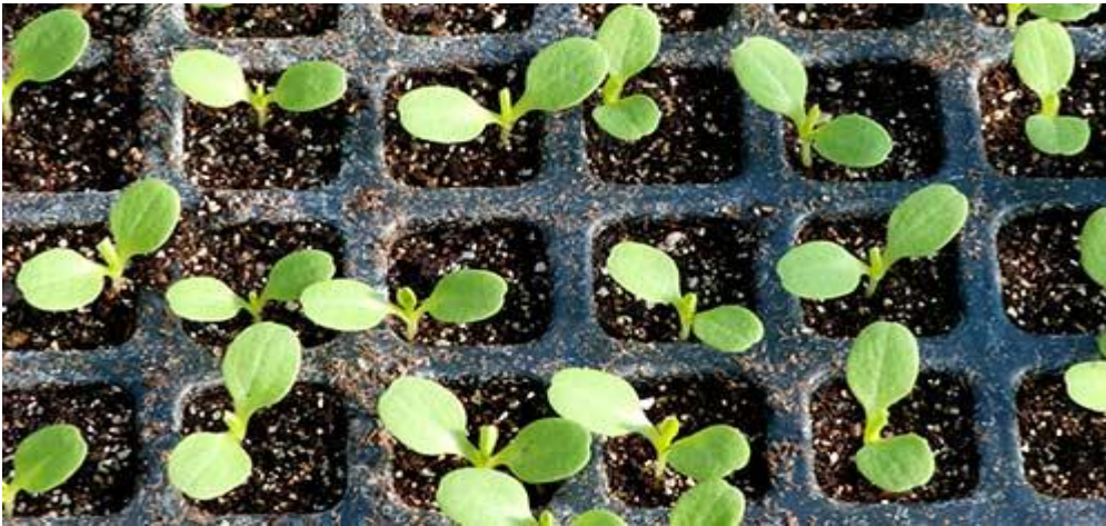
Brotos de alface - imagem original: http://flic.kr/p/bWWjcQ

Adubação: poucos dias antes da alface ser transplantada, espalhe 8 L de esterco de gado bem curtido e fino em cada metro quadrado do canteiro deixando este bem aplainado.